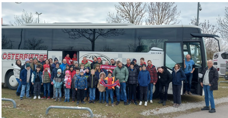
(Bericht und Bild: Florian Baur)

Zusätzlich durfte sich die Eintracht T.R.B. über eine weitere großzügige Spende der Sparkasse Nordschwaben freuen, die der Jugendarbeit des Vereins zugutekommt.